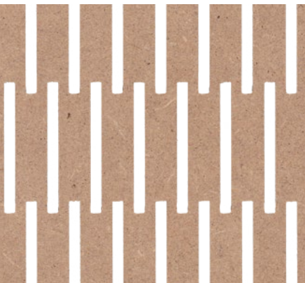
back side: 4/4 mm, MDF nature